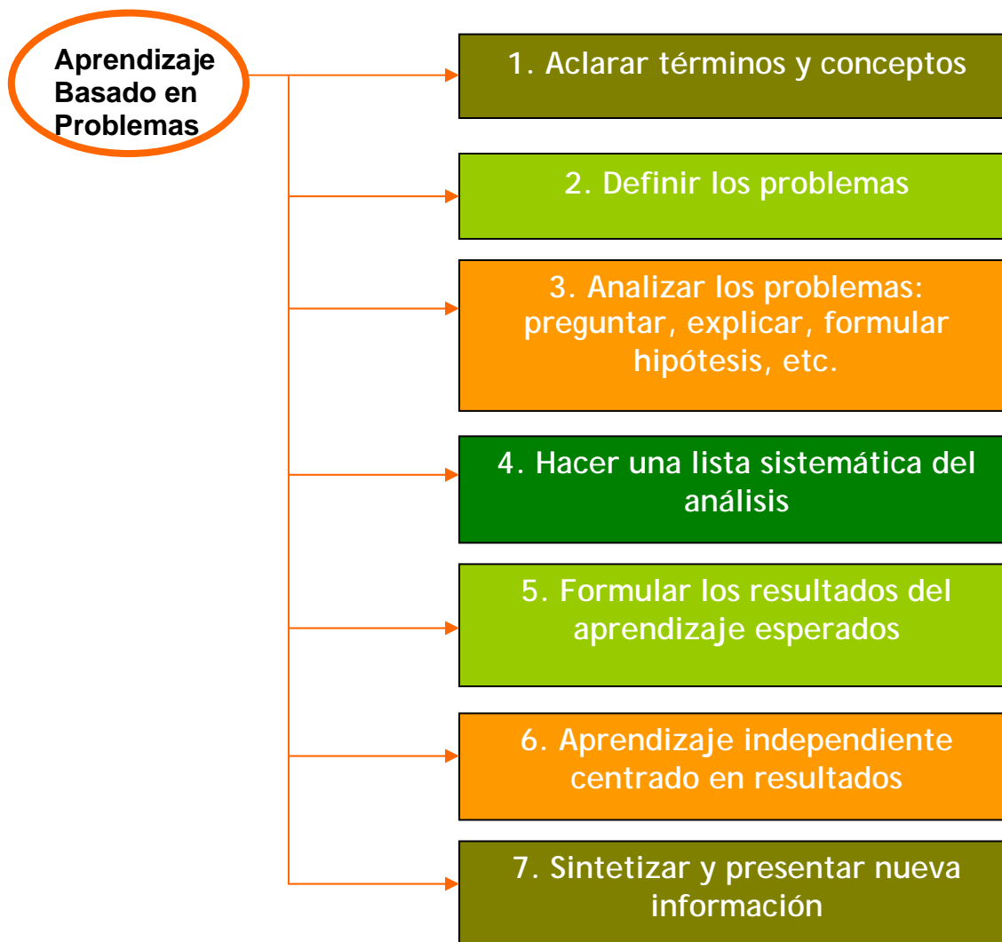
Figura II. Fases del Proceso de ABP (Exley y Dennick, 2007)

Otros autores, como Exley y Dennick (2007) realizan otra clasificación de las fases del ABP. Ellos señalan que son siete fases las que lo conforman.